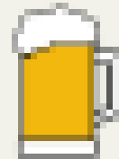
Článek v TRÁCHU