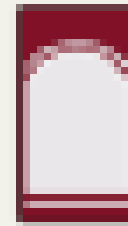
Článek v TRÁCHU